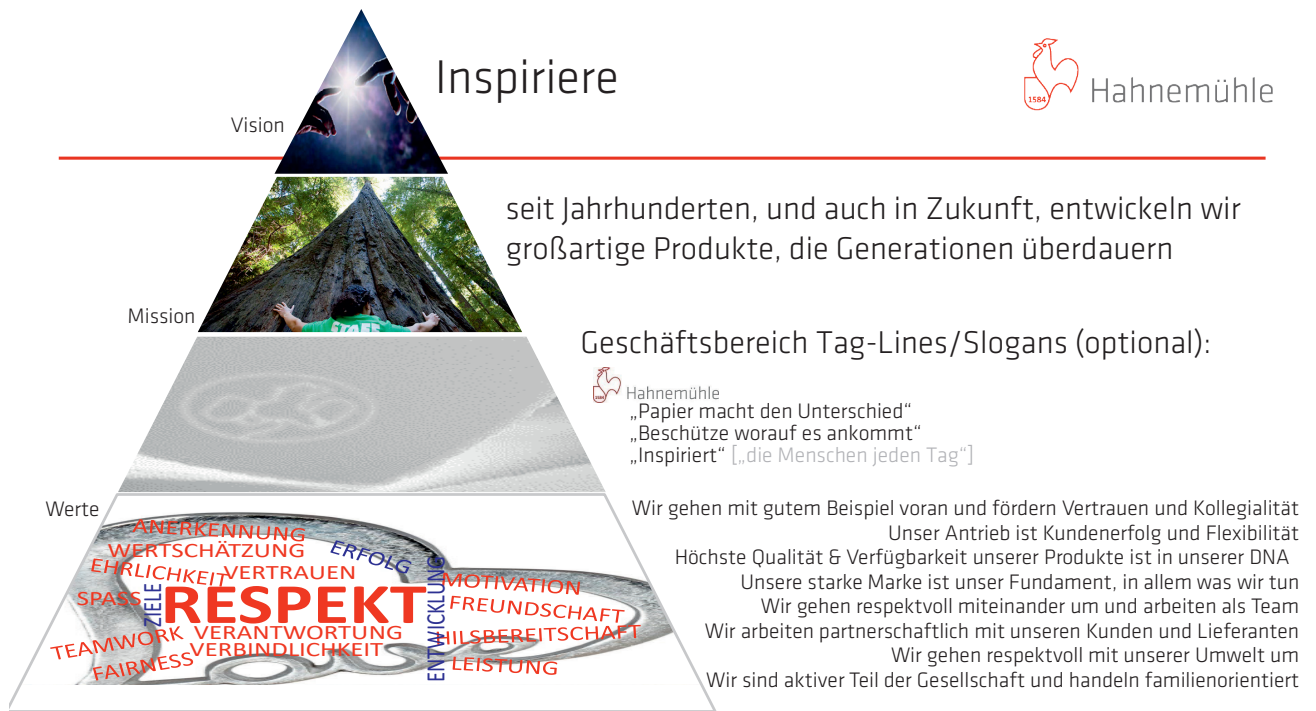
Visualisierung Wertekodex, Mission, Vision

Diese Visualisierung wird regelmäßig in Betriebsversammlungen besprochen und befindet sich seit 2019 auch als Aushang am schwarzen Brett. Unsere Werte, Mission und Vision sind spezifisch auf die Hahnemühle abgestimmte Richtlinien, an denen wir unsere Entscheidungen ausrichten und zusammenarbeiten wollen. Alle Mitarbeitenden sind aufgerufen, diese Richtlinien zu unterstützen. Die Richtlinien bauen auf den gesetzlichen und tariflichen Vorgaben auf, die das Fundament dieser Werte-Mission-Vision Pyramide bilden.